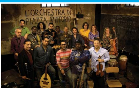
Orchestra di Piazza Vittorio