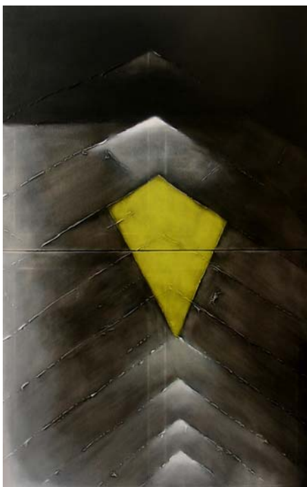
de que vontade

à esquerda: n°41 – «o desejar» | acrílico sobre tela | 81x130cm | 2005 «CORPOtraçoCORPO – a poesia e a pintura» | traço (cor): Laranja-Lima