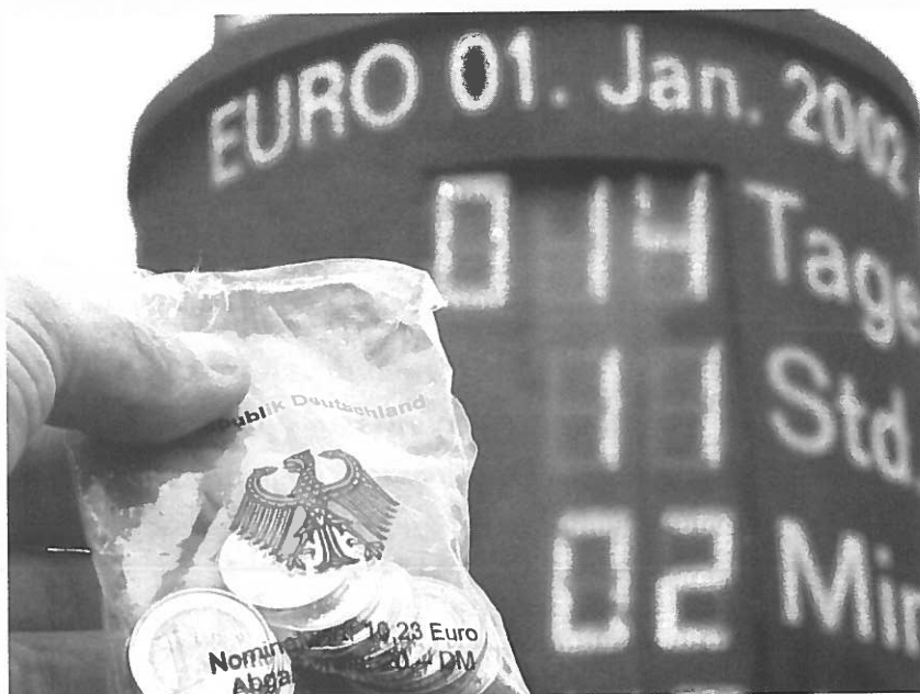
A contagem final para o Euro...

Janeiro – Criação do Instituto Monetário Europeu, embrião do